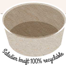
Saladier kraft 100% recyclable

Livraison offerte ou frais facturés suivant la localisation.