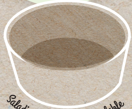
Saladier kraft 100% recyclable