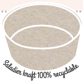
Saladier kraft 100% recyclable

Livraison offerte ou frais facturés suivant la localisation.