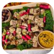
2. Terrine 100% poulet