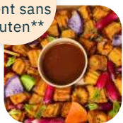
✓ 1. Mini-cannelés