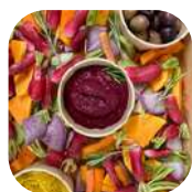
5. Crudités & tartinables de saison ✓