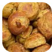
3. Gougères ✓