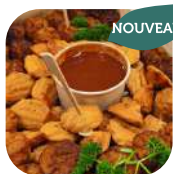
6. Madeleines salées ou mini-cookies ✓