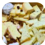
7. Fromages de chèvres locaux ✓