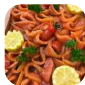
4. Poisson fumé